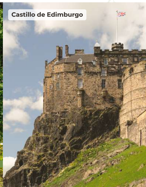
Castillo de Edimburgo