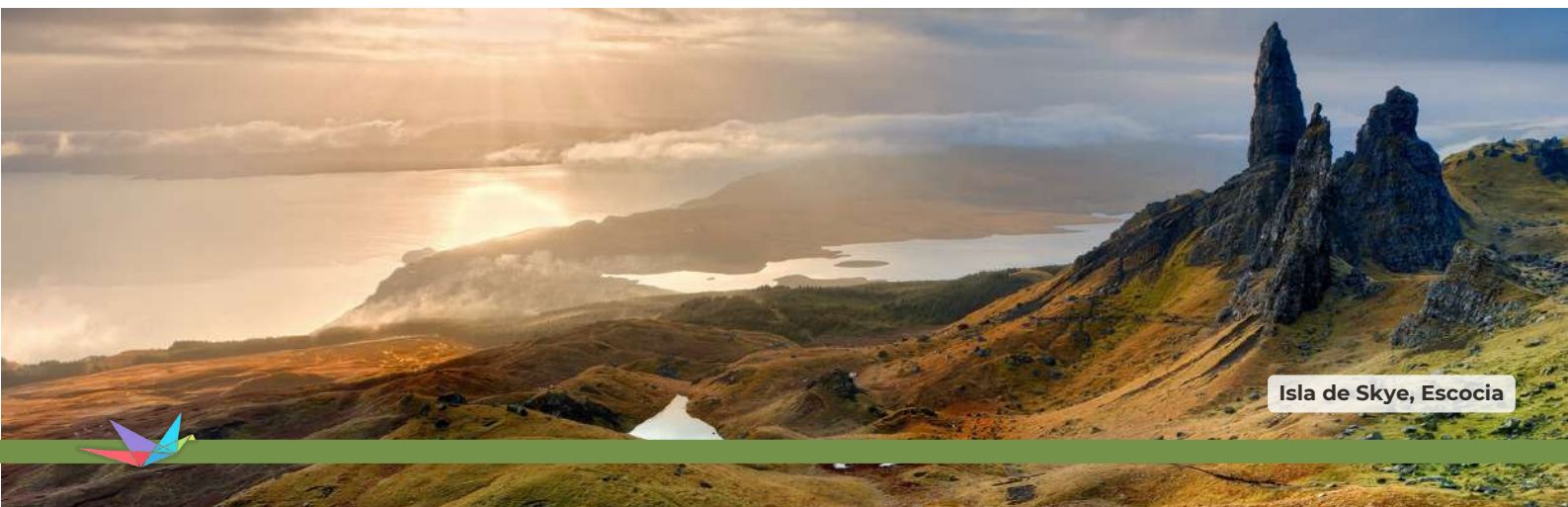
Isla de Skye, Escocia

Desayuno en el hotel. A continuación nos dirigiremos hacia al Lago Ness en busca de su ancestral huésped "Nessie". Podrán ver el Lago Ness desde las orillas y realizaremos una visita a las ruinas del Castillo de Urquhart, con vistas hacia el lago. Nuestra ruta continuará a orillas del lago hacia el oeste, pasando por el romántico Castillo Eilean Donan, hasta llegar a la mística Isla de Skye. Recorreremos los panoramas espectaculares de la isla disfrutando de vistas extraordinarias de los Cuillin Hill y llegaremos para ver la catarata Mealt y la roca Kilt detrás, antes de finalizar el día en el hotel. Cena y alojamiento en el Hotel Kings Arms en La Isla de Skye / Dunollie / Kyle Hotel in Kyle of Lochalsh / Gairloch Hotel en Gairloch, o similar.