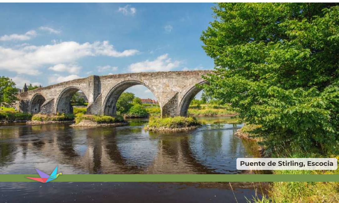
Puente de Stirling, Escocia

Día libre en Edimburgo hasta la hora del traslado de vuelta al aeropuerto de Edimburgo para su vuelo de salida con destino a Madrid en vuelo de línea regular. Llegada y fin de nuestros servicios.