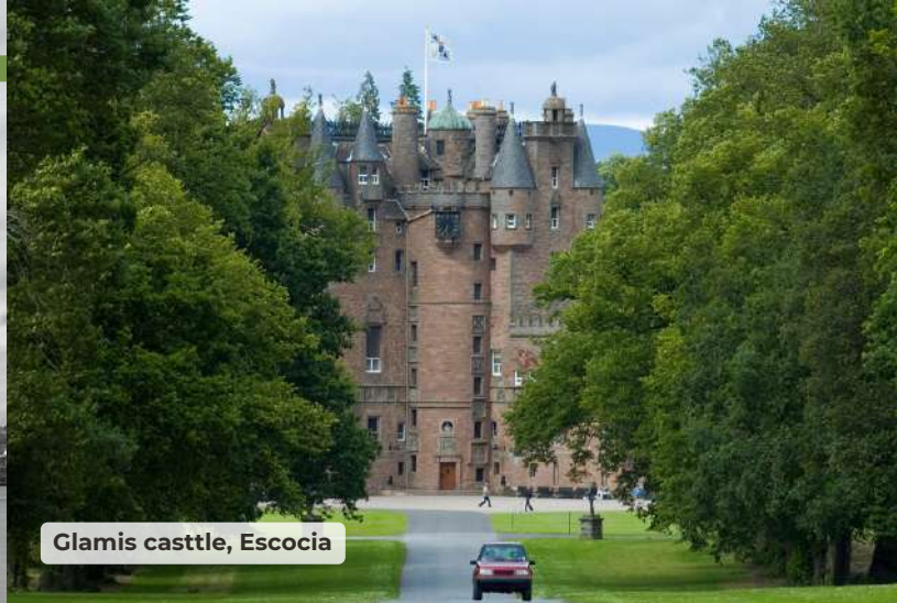
Glamis castle, Escocia