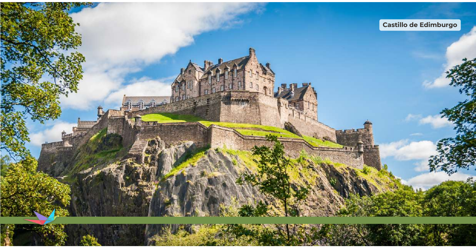
Castillo de Edimburgo

Desayuno en el hotel para luego salir a visitar la ciudad por la mañana, incluyendo entrada al Castillo de Edimburgo; tarde libre con la posibilidad de visitar la elegante "Georgian New Town" del siglo XVII y el histórico "Old Town". Edimburgo se considera la segunda ciudad más visitada del Reino Unido después de Londres y es también sede del parlamento escocés desde 1999. El edificio del parlamento es impresionante, vale la pena visitar su espacio verde en los jardines de Princess Street. Alojamiento y desayuno en el Hotel Holiday Inn Express Edinburgh City Centre / Hampton By Hilton Edinburgh / Holiday Inn Edinburgh / Ibis Edinburgh Centre South Bridge , o similar.